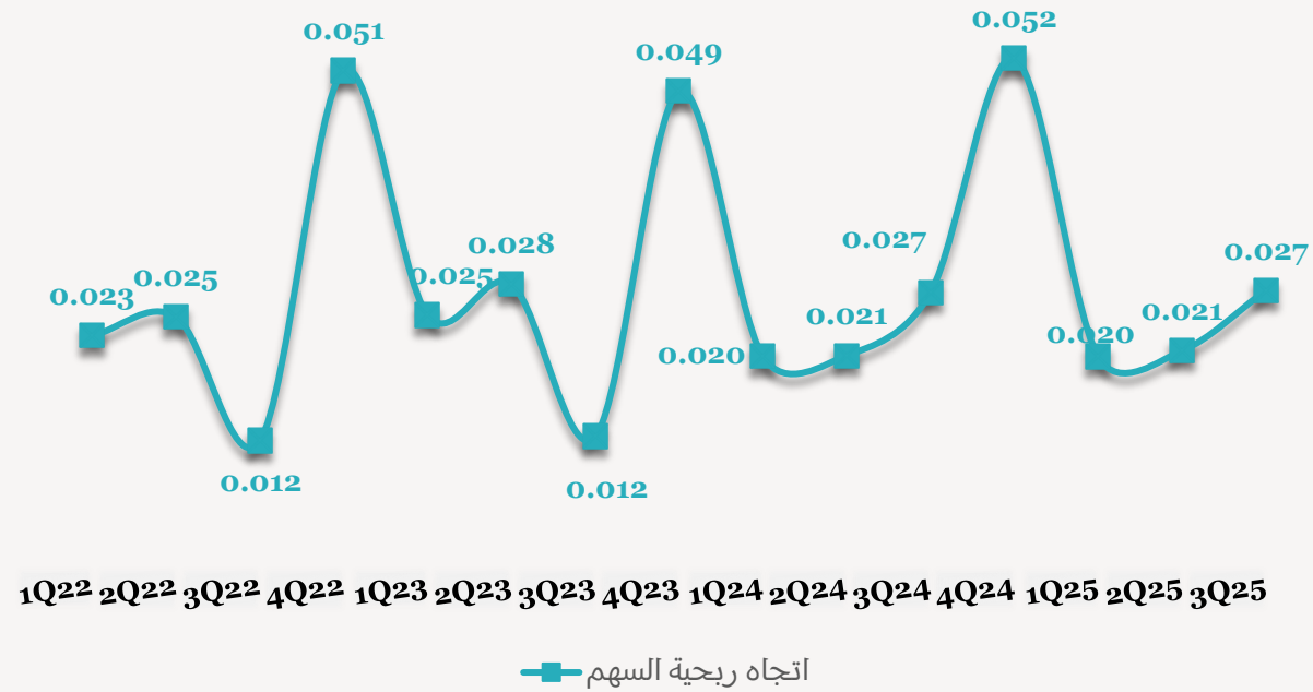
اتجاه ربحية السهم الربع سنوية (ريال قطري)